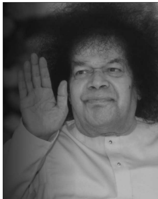
Jeden z obviněných: významný indický duchovní učitel Satja Sai Baba měl miliony stoupenců v Indii (a desetitisíce jinde na světě) a vliv na indickou politiku. Zatímco jedni ho chválili za humanitární a sociální aktivity, druzí poukazovali na to, že kouzelnické triky vydává za zázraky. V posledních letech jeho života přibyla vážná obvinění - také ze sexuálního zneužívání chlapců a mladých mužů.

Kvůli závislosti na vzájemné výměně uznání je charisma „v podstatě nejistým vlastnictvím, které vyžaduje neustálé posilování a ochranu...“ 21 „Charmatická autorita má totiž bytostně labilní základ“ 22 napsal Max Weber. S přibývajícím časem slábne ochota následovníků bezvýhradně charmatizovat svého vůdce, a charisma tak postupem času zevšedňuje a institucionalizuje se: „Hnutí pod charmatickým