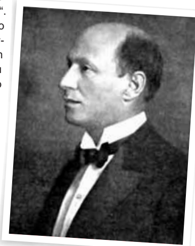
Abd-ru-shin roku 1927, ilustrace z knihy Moniky Schulzeové, „Abd-ru-shin. Autor Poselství Grálu“ , Integrál, Brno 2006

Je přirozené, že na základě duchovního hledání vznikají v každé době nová náboženská hnutí. Jsou tvořena lidmi, kteří jsou nespokojeni s duchovním životem většiny. Každé nové náboženské hnutí tak v sobě obsahuje protest a vůči větší nové společnosti se vymezuje. Jeho stoupenec tento protest vyjadřuje vírou, praktikami, hodnotami, morálkou, životním stylem apod., které jsou odlišné od víry, morálky atd. většiny. Kvůli těmto odlišnostem od toho, co většina běžně považuje za „normální“, bývá protestující hnutí často odsuzováno. Výrazem odsouzení a odmítnutí novoty je slovo „sekta“. Některé takto označené skupiny skutečně mohou být nebezpečné svým stoupenecům nebo jejich okolí. Negativním slovem „sekta“ jsou někdy ale postížena i ta nová náboženská hnutí, která se „neprovinila“ ničím jiným než tím, že jsou nová, jiná a ve společnosti dosud neznámá.