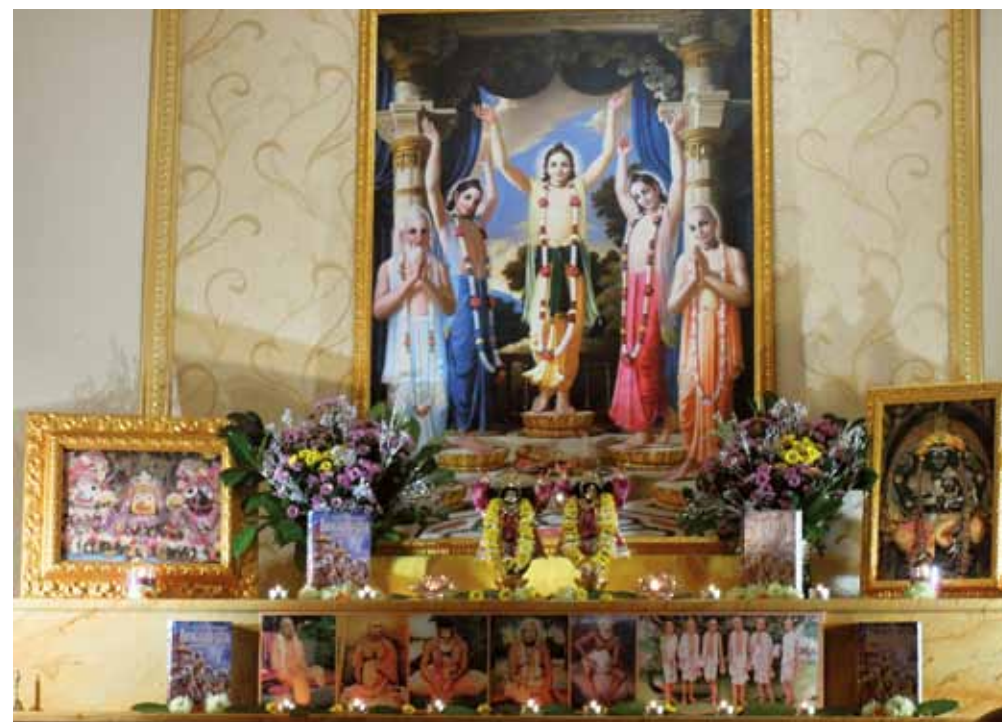
VLEVO: Oltář v Harinam mandir hnutí Hare Krišna v Praze. VPRAVO: Z chrámu vietnamského buddhismu ve Svatém kříži u Chebu

vliv osvícenství, patrný i jinde v Evropě, byl v českých zemích zvláště v druhé polovině 19. století ještě posílen národním hnutím. Idea češství totiž čerpala hlavně z nekatolických zdrojů a napájela se pocitem křivdy ze strany církve, těsně spjaté s habsburskou monarchií, a ze vzdoru vůči ní. To způsobilo, že příslušnost mnoha Čechů k římskokatolické církvi se stala formální a i praktikující katolíci si udržovali kritický odstup od církve a jejich postojů a požadavků. Kulturní atmosféra samostatného Československa, ideologie komunistů i politické události posledních desetiletí (například již připomenuté církevní restituce) tuto nedůvěru už jen posilovaly a zahruly do ní i jiné náboženské instituce.