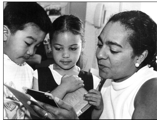
Výchova znamená předávání hodnot, samozřejmě i těch náboženských

Na závěr: sborník neobsahuje žádné vyslovené hluché místo a celkově má špičkovou úroveň. Jednotlivé příspěvky se liší především tím, zda jsou zaměřeny spíše popisně (Coleman, Introigne, Hardmanová),