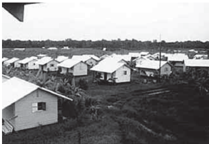
Domky v osadě

➔ V důsledku tlaku vnějšího světa hnutí Svatyně lidu založilo zemědělskou osadu Jonestown v jihoamerické Guyaně