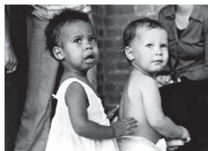
„Duhové děti“ v Jonestownu

a získali příznivce i na jiných místech. Počet lidí zapojených do aktivit hnutí dosáhl po několika letech tisíců a jeho centrem se roku 1972 stalo San Francisco.